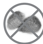
PALHA DE AÇO

Qualquer dúvida entre em contato com a Ritallio pelo telefone +55 48 32635380 ou através do nosso site www.ritallio.com.br