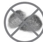
PALHA DE AÇO