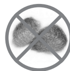
PALHA DE AÇO

Qualquer dúvida entre em contato com a Ritallio pelo telefone +55 48 32635380 ou através do nosso site www.ritallio.com.br